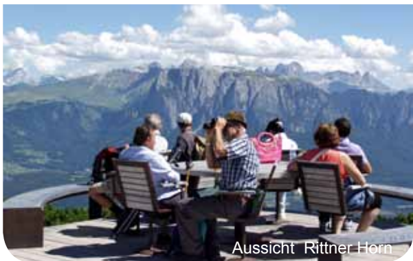
Aussicht Rittner Horn