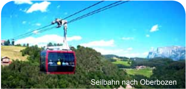
Seilbahn nach Oberbozen