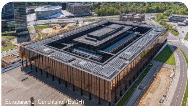
Europäischer Gerichtshof (EuGH)