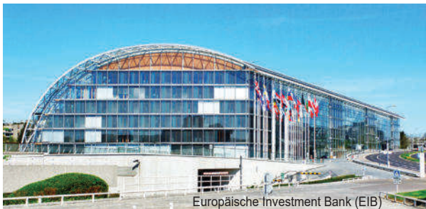
Europäische Investment Bank (EIB)